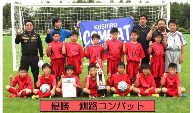
優勝 釧路コンバット